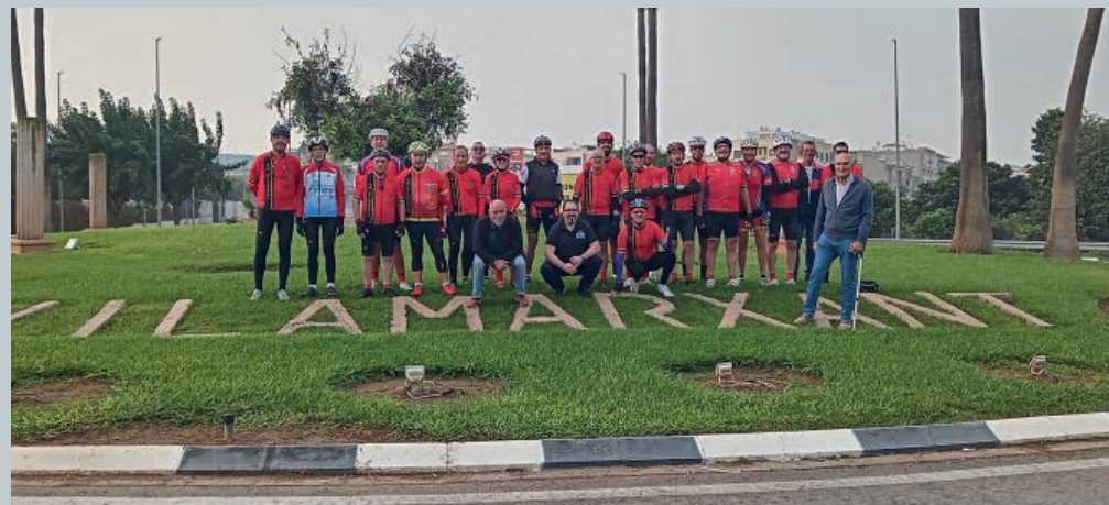
PENYA CICLISTA DE VILAMARXANT

L'escola municipal de Karate de Vilamarxant els desitja unes bones festes.