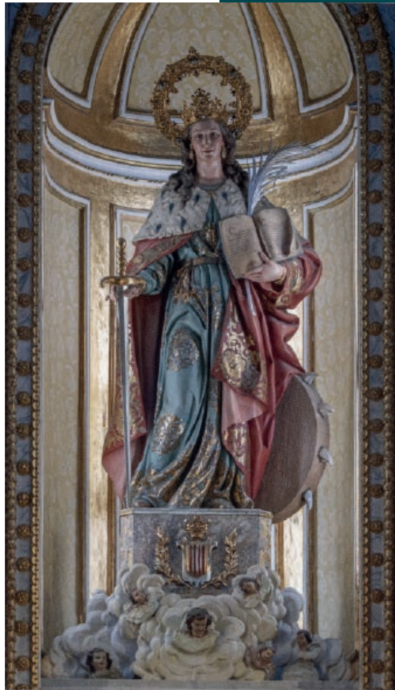
Santa Caterina Verge i Màrtir Patrona de Vilamarxant.