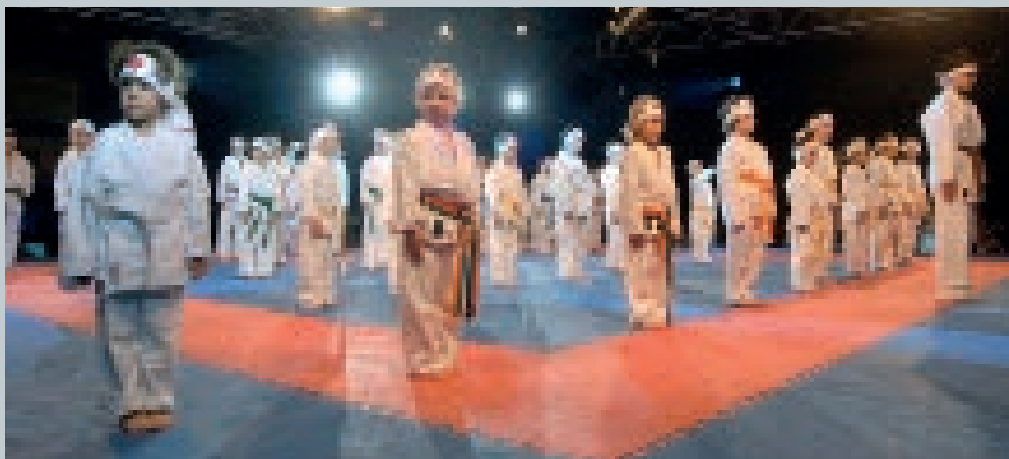
ESCOLA MUNICIPAL DE KARATE

L'escola municipal de Karate de Vilamarxant els desitja unes bones festes.